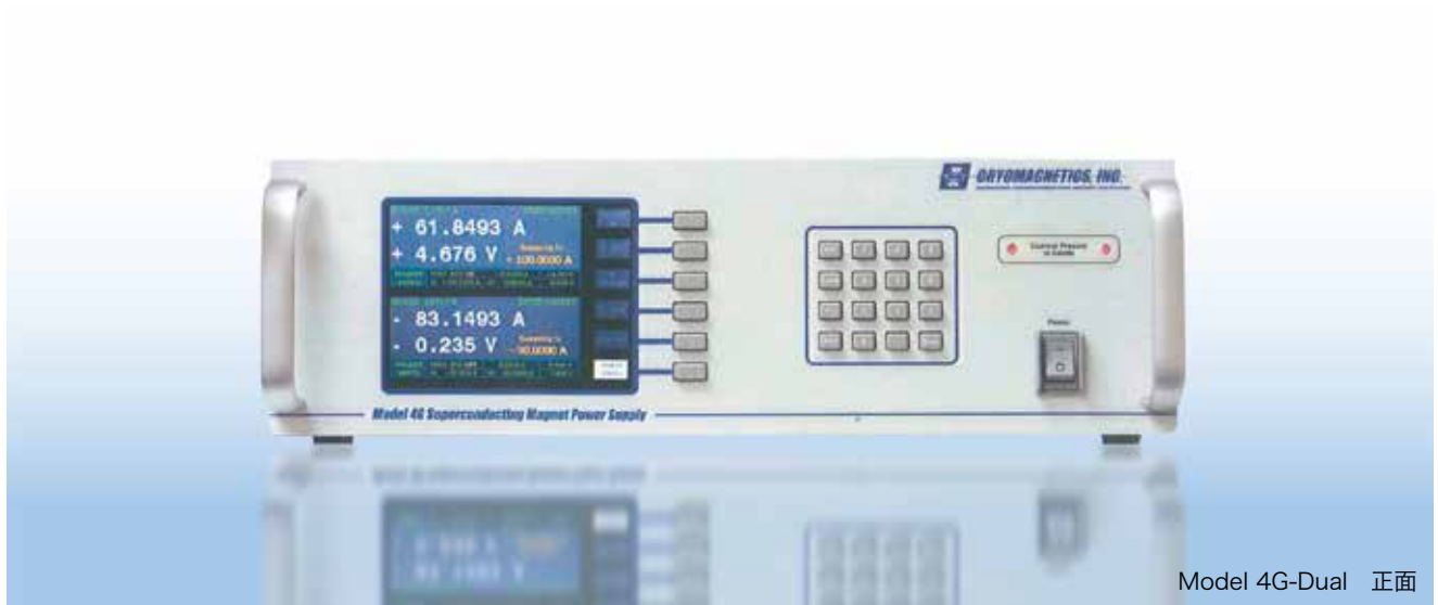
Model 4G-Dual 正面