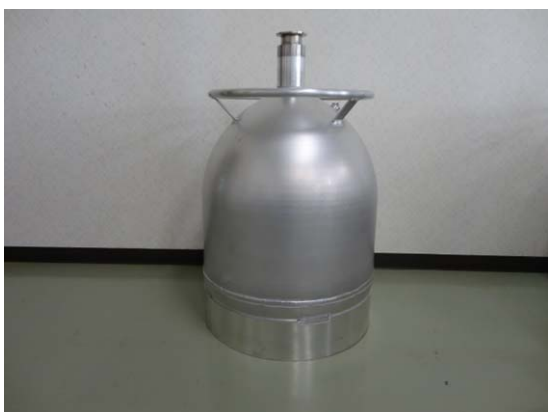
容器写真(シーベル 30)